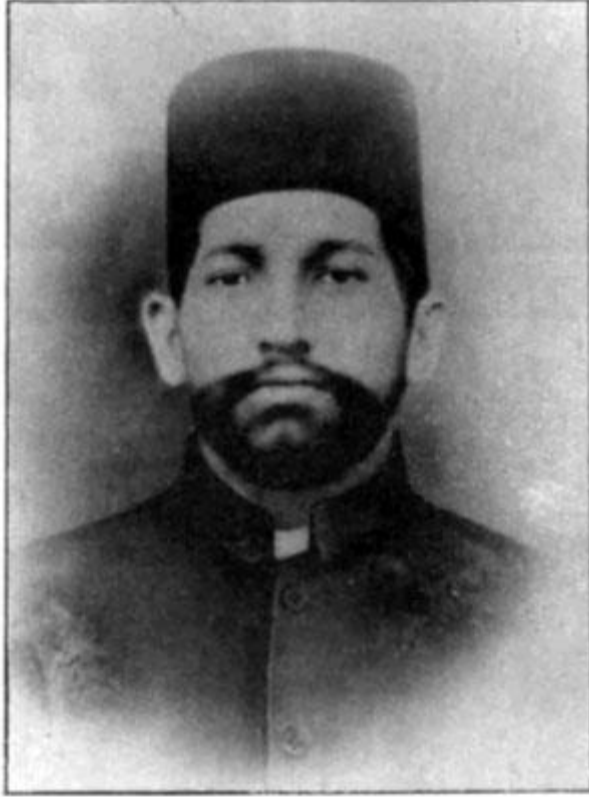
حڪيم قاضي عبدالقيوم